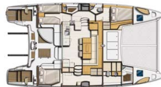
Propriétaire / Owner